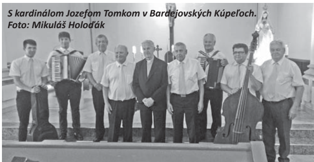
S kardinálom Jozefom Tomkom v Bardejovských Kúpeľoch.

ktorí sú od nich vekovo starší o 50-62 rokov. Patrí im veľká vďaka. Obraciam sa preto aj na ostatných mladých ľudí, ktorí majú talent a prišli by k nám do Glórie - každý bude vítaný. Moje poďakovanie patrí aj obecnému zastupiteľstvu, ktoré nám každoročne poskytuje dotáciu na fungovanie našej činnosti. A úplne na záver - pozývam Vás na benefičný koncert, ktorý sa uskutoční dňa 29. 12. 2019 so začiatkom o 15.30 hod. v našom farskom kostole sv. Martina. Všetci ste srdečne pozvaní.