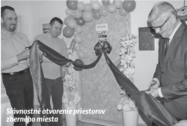
Slávnostné otvorenie priestorov zberného miesta

budeme zbierať a na koho sa budeme orientovať. Keďže ja mám veľmi blízky vzťah k deťom, rozhodla som, že sa budeme zameriavať na deti od narodenia do dvanásteho roku života. V rámci projektu „Pomôž nám pomôcť“ sa teda orientujeme na rodiny s deťmi, pre ktoré zbierame nielen šatstvo, ale aj hračky, knižky, kočíky a iné veci, ktoré nám poskytnú naši darcovia. Čo sa týka názvu, tak ten vznikol úplne spontánne v škole cez veľkú prestávku, keď som už mala naozaj plnú schránku správ od potenciálnych darcov, preto som sa rozhodla, že založím facebookovú stránku, na ktorej by nás mohli ľudia kontaktovať. Takáto stránka však potrebovala názov, ktorý by čo najlepšie vystihoval našu činnosť. A tak vznikol názov „Pomôž nám pomôcť“, ktorým sme chceli vyjadriť myšlienku, že na to, aby sme mohli pomáhať tým, ktorí to veľmi potrebujú, potrebujeme najprv pomoc od našich darcov.“