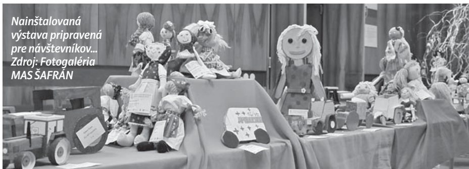
Nainštalovaná výstava pripravená pre návštevníkov...