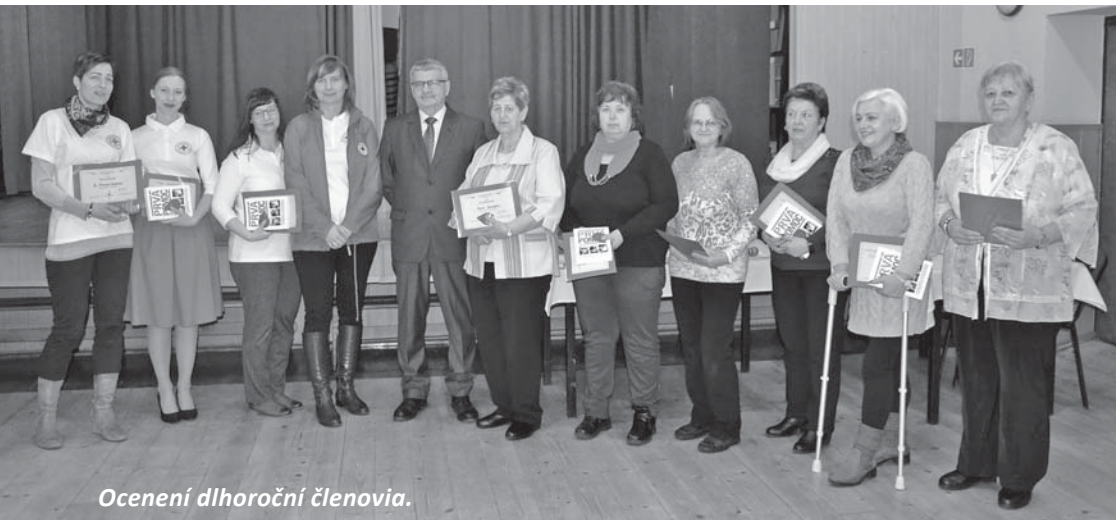
Ocenení dlhoroční členovia.

zory na podujatiach obce patria naďalej k hlavnej činnosti spolku, obnovuje sa vybavenie lekárničiek a ošatenie. Prostredníctvom mládeže je spolok zaangažovaný v projekte Evička a deti, neskôr Dorotka a priatelia. Zapája sa do aktivít – Pôstnej polievky, osláv Dňa detí ukážkami prvej pomoci, organizuje besedu s pediatrom, slávnostne oceňuje držiteľov plaket Dr. Jánskeho, vzdeláva v oblasti prvej pomoci škôlkarov i seniorov.