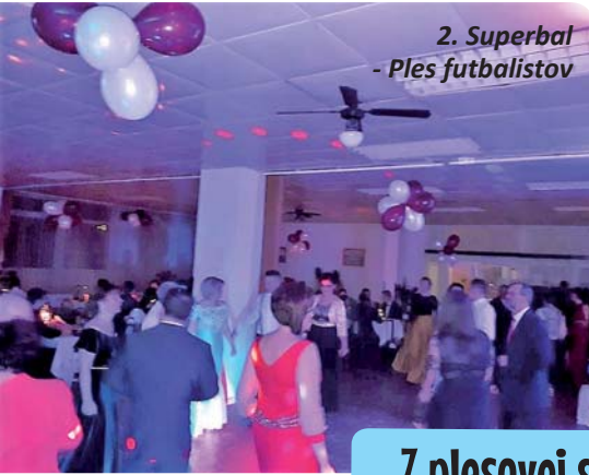
2. Superbal - Ples futsalov