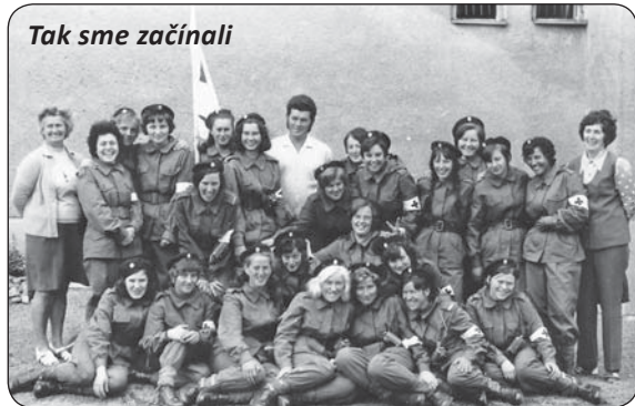
Tak sme začínali

Zavádzajú sa mobilné odbery krvi v obci. Zdravotné do-