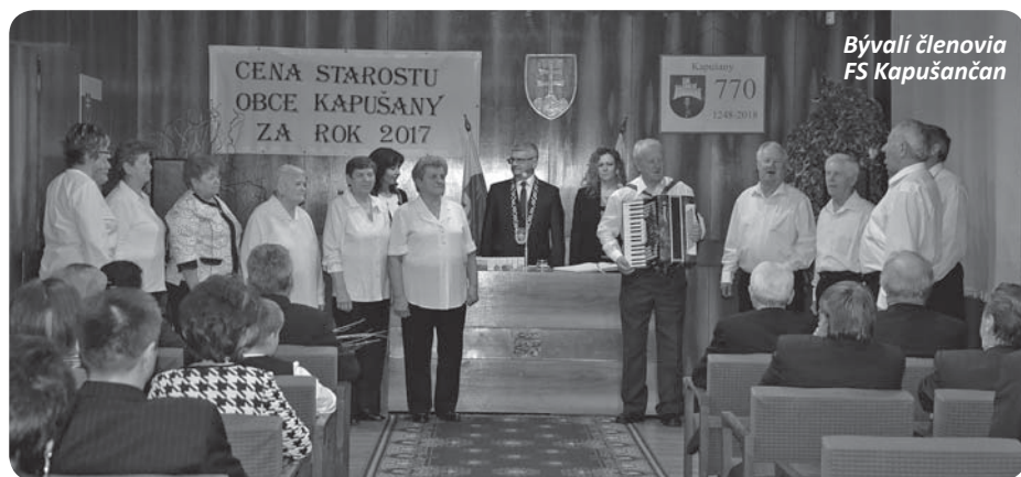
Bývalí členovia FS Kapušančan