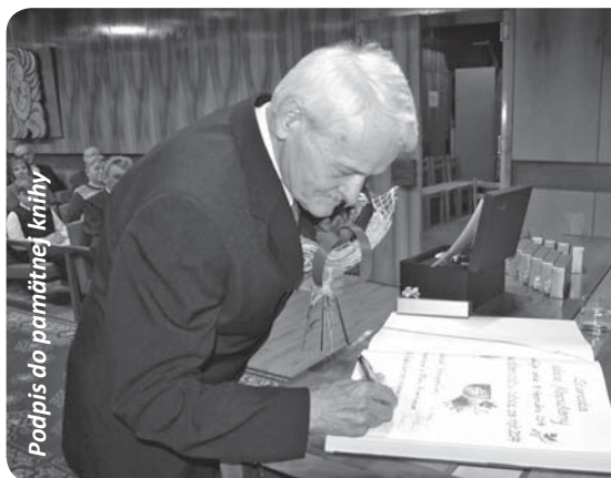
Podpis do pamätnej knihy