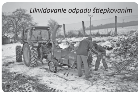
Likvidovanie odpadu štiepkovaním

V obci Kapušany je zabezpečený zber komunálneho odpadu a triedený zber papiera, skla, pet fliaš, zmiešaných plastov, elektroodpadu, kovových obalov, nebez-