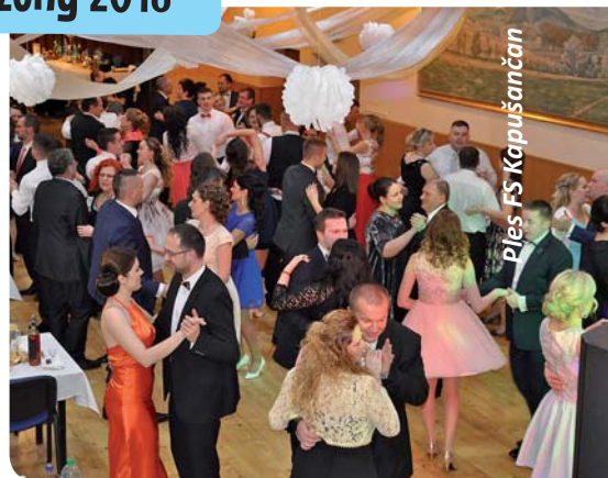
Ples FS Kapušancan