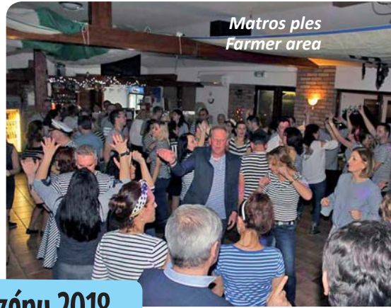
Matros ples Farmer area