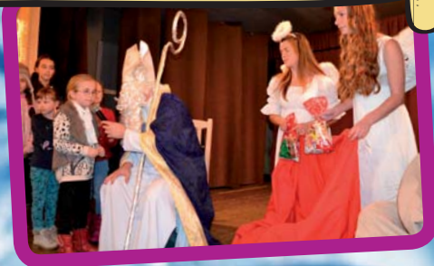
Mikulášska nádielka [3]