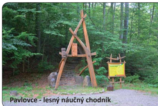
Pavlovce - lesný náučný chodník

Vlastivedné múzeum a Archeopark — živá archeológia v Hanušovciach nad Topľou