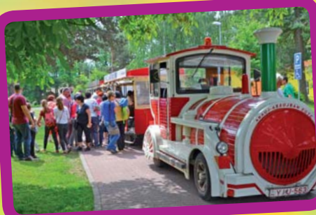
Deň detí v Kapušanoch [3]