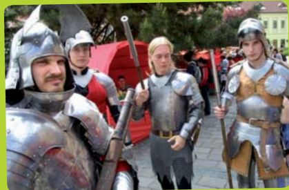
Z činnosti Spolku šarišských šermiarov [14]