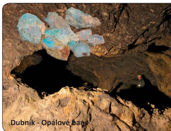
Dubník - Opálové bane