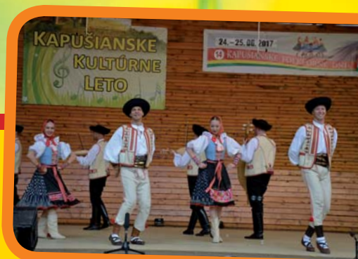
14. Kapušianske folklórne dni [6]