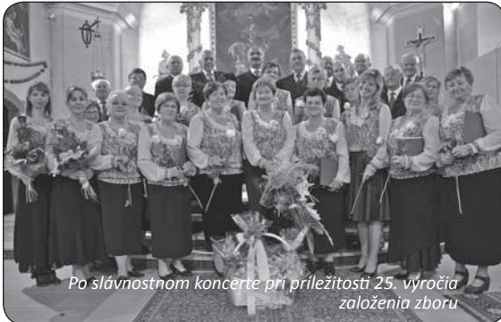
Po slávnostnom koncerte pri príležitosti 25. výročia založenia zboru