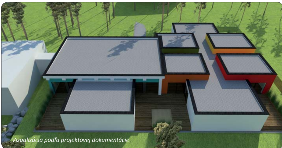
Vizualizácia podľa projektovej dokumentácie