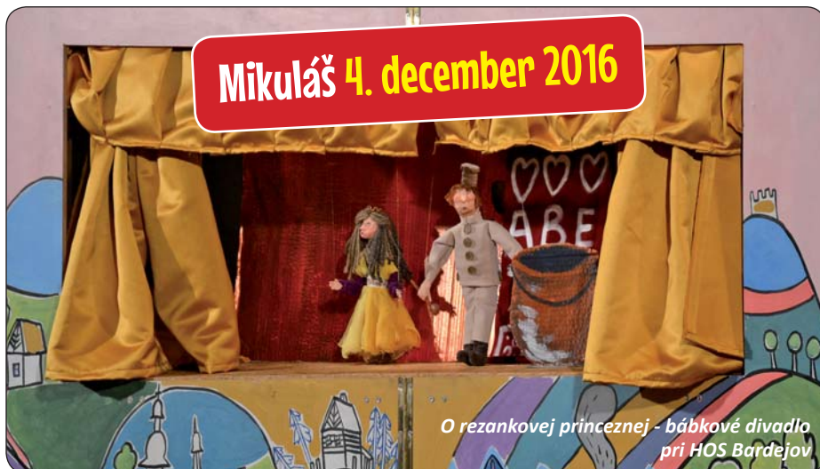
O rezankovej princeznej - bábkové divadlo pri HOS Bardejov