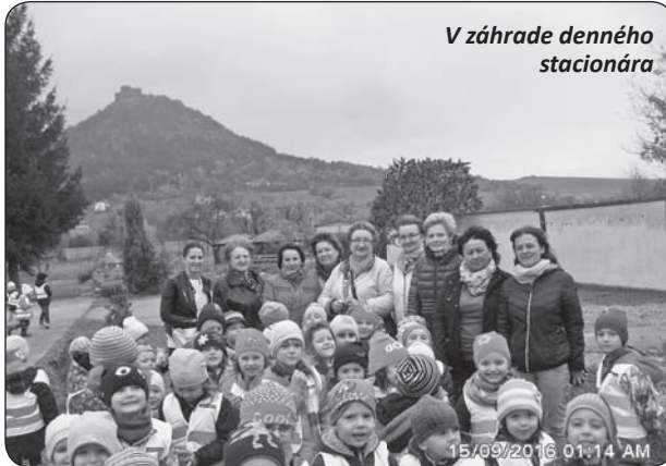
V záhrade denného stacionára

V októbri sa deti učili aj o tom, ako sa zdravo stravovať. Učiteľky im pripravili aj zdravé ovocné, ovocno-zeleninové šalátiky a ovocné šťavy z plodov našich záhrad. Viaceré deti, ktoré veľmi ovocie a zeleninu neobľubujú, si na šalátikoch pochutnali a našli sa aj také, ktoré neváhali a dali si aj „šalátikovu dupľu“.