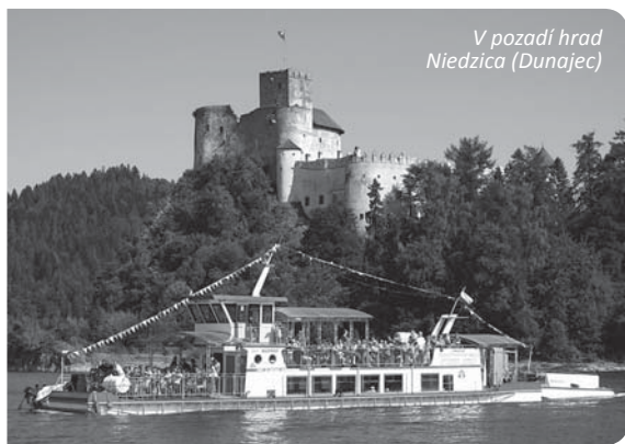
V pozadí hrad Niedzica (Dunajec)

Výletná plavba loďou Harnas – obdivovanie krás Czorsztynského jazera