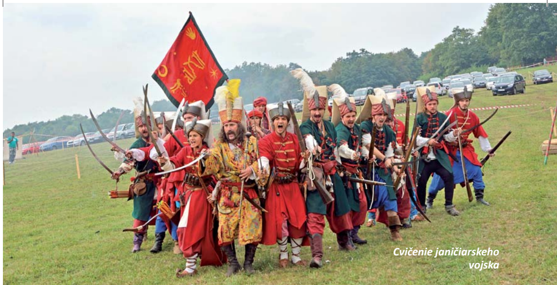
Cvičenie janičiarskeho vojska

ho rytierskeho turnaja – kvôli bezpečnosti koní aj divákov) a vyvrcholil koncertom poľskej rockovej skupiny Blackout a po zotmení ohňovou šou. Nedeľný program prebiehal už priamo na hrade a začal popoludní o 14.00 dobýjaním hradu. “