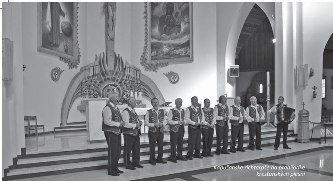
Kapušanske richtaroše na prehľadke kresťanských piesní