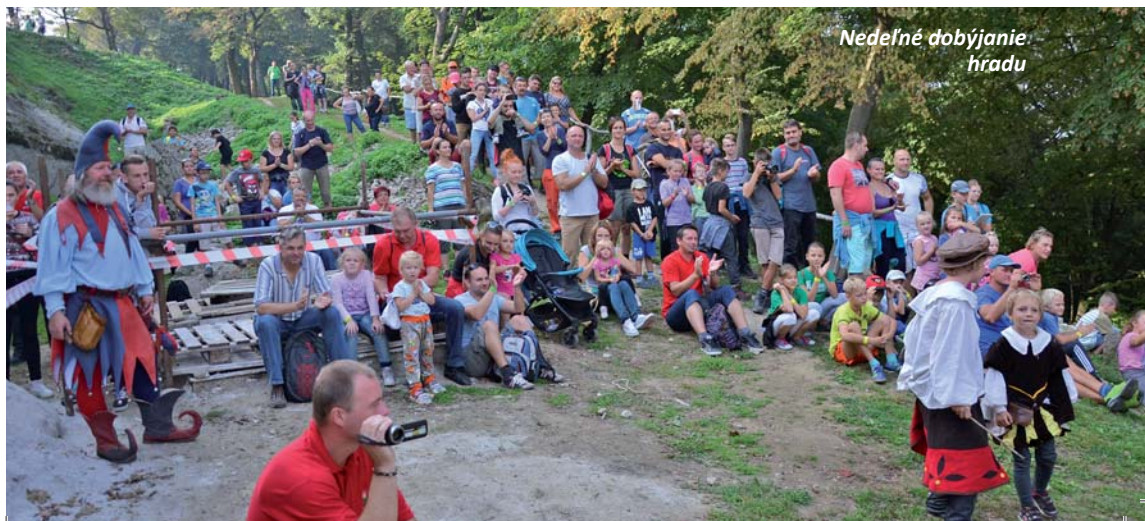
Nedeľné dobýjanie hradu