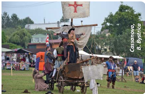
Cassanova, B. Bystrica