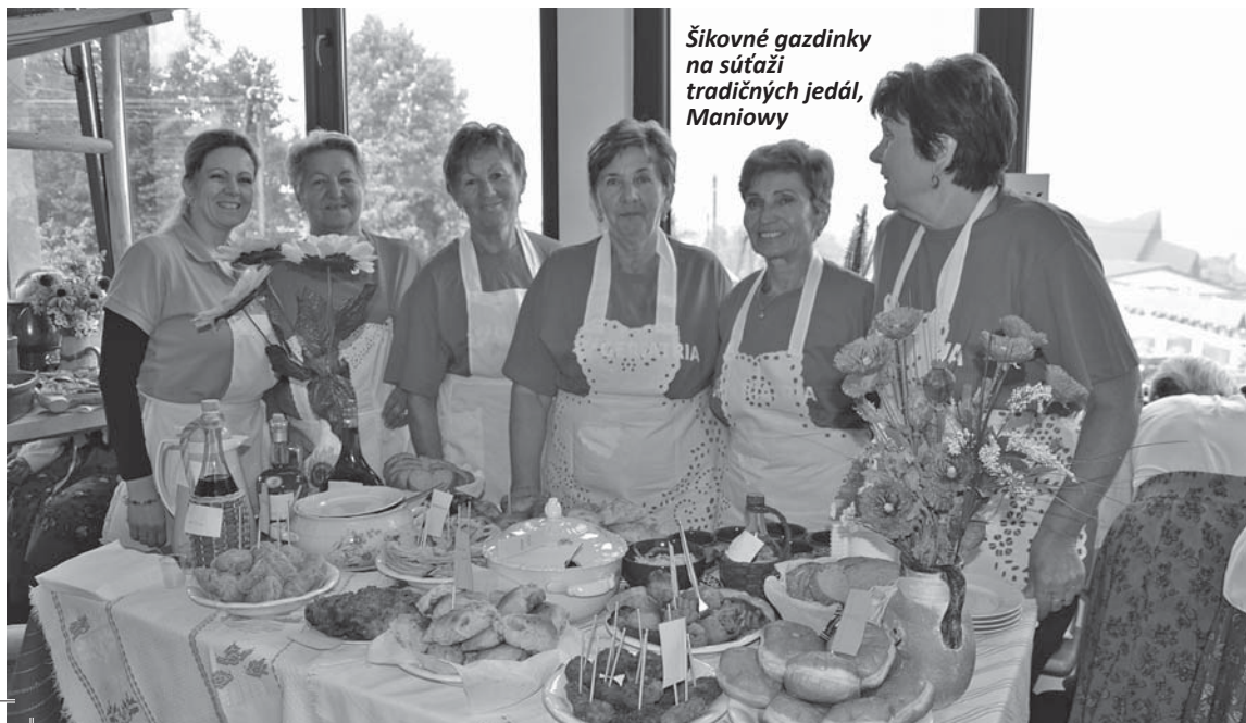
Šikovné gazdinky na súťaži tradičných jedál, Maniowy

Od začiatku nadväzovania partnerstiev sme hľadali ako potenciálnych partnerov obce, v ktorých území sa nachádza hrad, v prípade gminy Czorsztyń hrad s rovnakým názvom. V blízkosti týchto našich hradov viedla v minulosti Kráľovská cesta z Krakova do Budína, po ktorej sa sku-