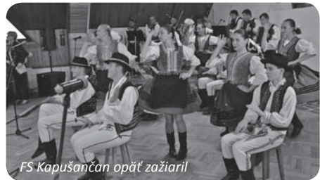
FS Kapušančan opäť zažiaril