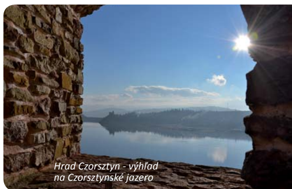
Hrad Czorsztyn - výhľad na Czorsztynské jazero

točne pohybovali králi. Vladislav Jage-lonský, ktorý v roku 1440 daroval Kapu-šiansky hrad šľachticom z Rozhanoviec, tadiaľto cestoval na svoju korunováciu. Zároveň táto cesta spája aj ďalšie hrady nachádzajúce sa na tejto ceste, čižme v budúcnosti môžeme rozšíriť spoluprá-cu s týmito hradmi a vytvoriť spoločný turistický produkt. Hrad Czorsztyn aj náš Kapušiansky hrad sa nachádza v chrá-nej prírodnej oblasti, z čoho vyplývajú určité obmedzenia pre konanie podujatí a ponuku služieb na hradoch. Naším zá-merom je prilákať turistov z hradov aj do našich obcí a vytvoriť im kvalitnú ponuku informácií a služieb. Turista bude objavo-vať tajomstvá podhradí prostredníctvom kvalitnej infraštruktúry a zážitkového tu-rizmu, očakávame zvýšenie návštevnosti