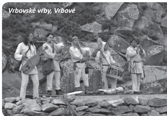
Vrbovské vrby, Vrbové