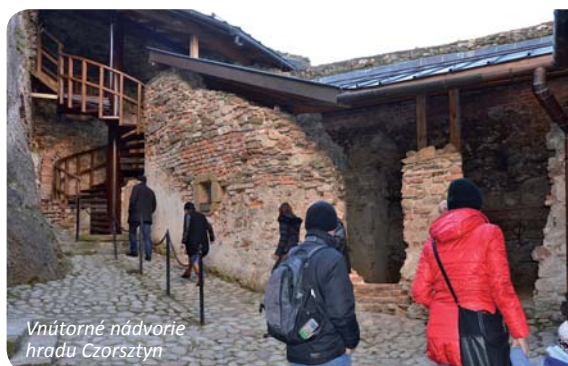
Vnútorne nádvorie hradu Czorsztyn