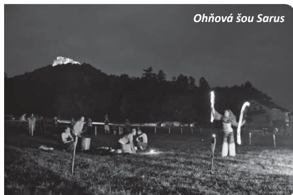
Ohňová žou Sarus