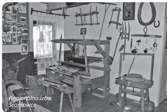
Regionálna izba, Sromowce

Platí sa v pokladni parkoviska, hrad je z parkoviska vzdialený 5 min. chôdze.