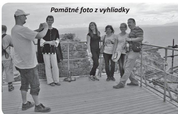
Pamätné foto z vyhlídky