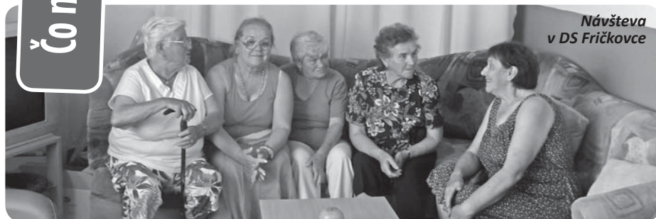
Návšteva v DS Fričkovce

A trium, n.o., prevádzkovateľ Denného stacionára Kapušany oznamuje, že je voľných posledných päť miest pre prijatie do tohto zariadenia.