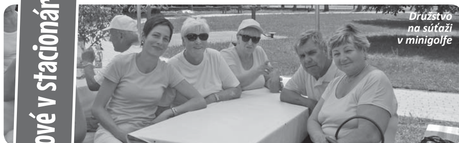
Družstvo na súťaži v minigolfe