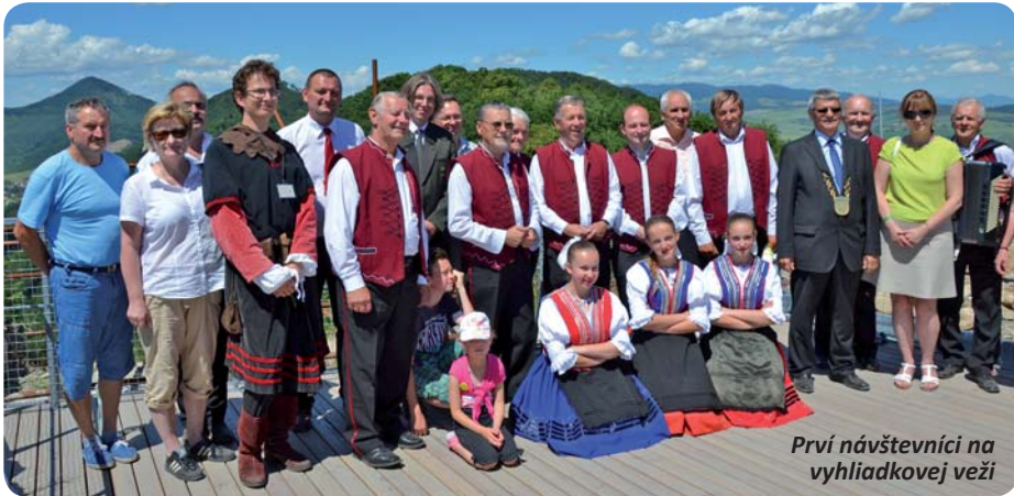
Prví návštevníci na vyhliadkovej veži

pušianskeho hradu a taktiež počas hradných slávností. Výstupom na vyhliadkovú vežu návštevník príspevkom 1 € (deti od 10 – 18 rokov, dôchodcovia 0,50 €) podporí obnovu a prevádzku hradu a zároveň