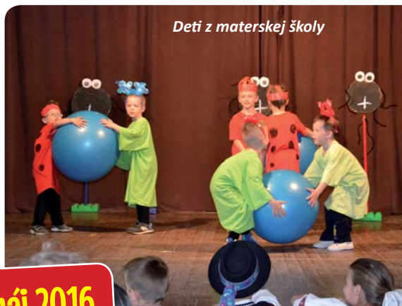
Deti z materskej školy