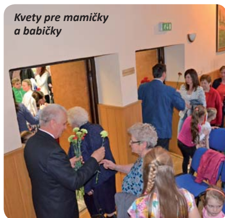
Kvety pre mamičky a babičky