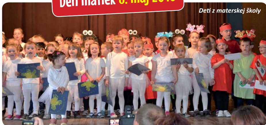
Deti z materskej školy