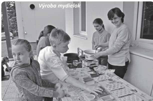
● Výroba mydielok

Kapušany sa do tejto akcie zapojili po prvýkrát, v sobotu 11. 6. 2016. Pre náv-