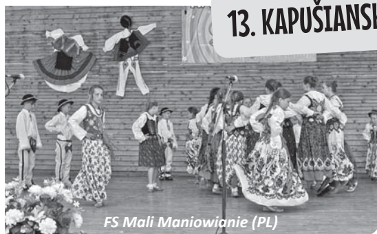
FS Mali Maniowianie (PL)