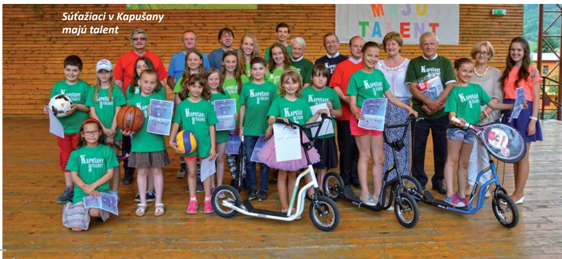
Súťažiaci v Kapušany majú talent

V tento deň je zvykom, že sa na školách neučí, prípadne neskúša. Nie je to ináč ani v našej škole, ZŠ s MŠ Kapušany. Počasie nám prišlo, preto sme zorganizovali pre všetkých žiakov školy hudobný koncert, žiaci boli spokojní a šťastní - jednoducho Deň detí ako sa patrí. Koncertu však predchádzala súťaž Kapušany majú talent, ktorá sa uskutočnila počas víkendú ako súčasť obecných osláv Dňa detí. Deti sa zabávali a taktiež sa učili vzájomnej podpore a pomoci, keď podporovali a povzbudzovali všetkých súťažiacich. Súťaž sprevádzali rôzne atrakcie, animácie s deťmi, malý jarmok. Celý program bol príjemným spštením osláv detskej radosti a spokojnosti. Tohtoročné MDD sa skutočne podarilo. Už teraz sa tešíme na ďalší rok a dúfame, že bude minimálne taký skvelý ako tento. -RR-