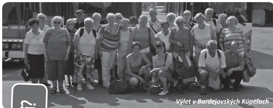
Výlet v Bardejovských Kúpeľoch