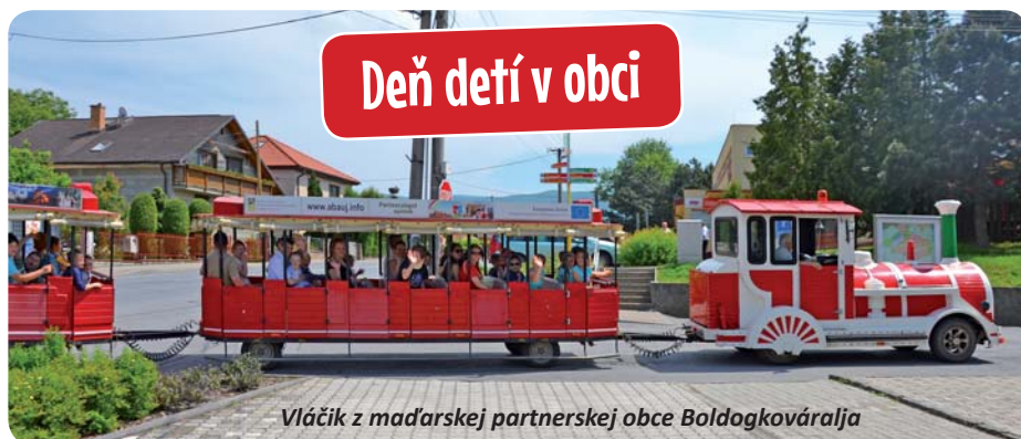
Vláčik z maďarskej partnerskej obce Boldogkóváraalja