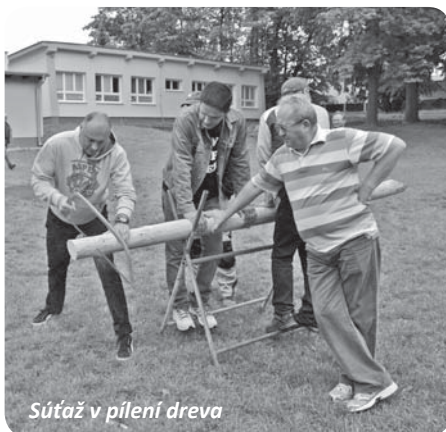
Súťaž v pílení dreva

števníkov Parku svätých Cyrila a Metoda boli pripravené komentované prehliadky jeho odľahlých zákutí, týkajúce sa histórie parku a kaštieľa a rozoznávania drevín.