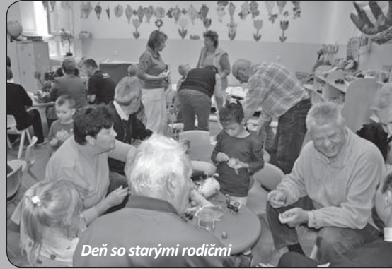
Deň so starými rodičmi

... aj takto si žijeme v materskej škole