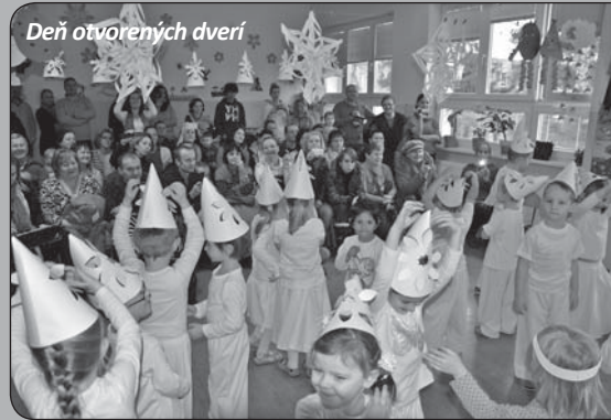
Deň otvorených dverí