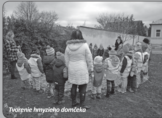
Tvorenie hmyzieho domčeka