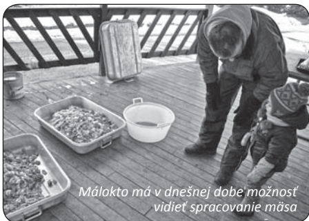
Málokto má v dnešnej dobe možnosť vidieť spracovanie mäsa

ako určitá demonštrácia tradičnej činnosti, keď sa ešte v domácnostiach choval dobytok, pričom najmä mladšia generácia a deti málokde majú možnosť vidieť proces spracovania mäsa a mäsových výrobkov.