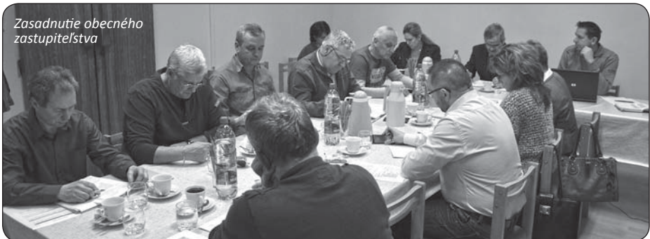
Zasadnutie obecného zastupiteľstva

Obecné zastupiteľstvo v Kapušanoch odvoláva redakčnú radu občasnika Pod Kapušianskym hradom.