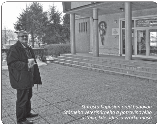
Starosta Kapušian pred budovou Štátneho veterinárneho a potravinového ústavu, kde odnáša vzorku mäsa

mín mjasopust (koniec jedenia mäsa pred pôstom). V tom poňatí obecná zabíjačka a pochovávanie basy ako bodka za obdobia hodovania má svoj význam, rovnako