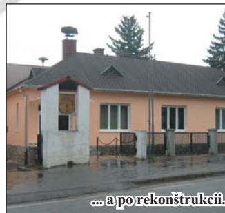
... a po rekonštrukcii.

Nie je hanba spadnúť, ale zostať príliš dlho ležať.