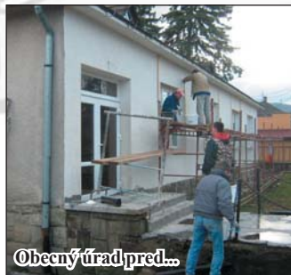
Obecný úrad pred...