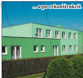
... a po rekonštrukcii.