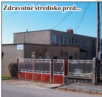
Zdravotné stredisko pred...

V rámci dobrovoľníckej služby obec Kapušany ponúka svojim občanom možnosť bezplatného využívania týchto služieb: sociálne poradenstvo, pomoc pri vyplňaní tlačív, žiadostí a dokumentov, pomoc pri vybavovaní sociálnych dávok, pomoc pri vybavovaní zdravotníckych pomôcok pre ZŤP, zisťovanie rozsahu nároku a následné usmernenie, možná asistancia pri odbornom zdravotnom vyšetrení, informačný servis, kontakt so spoločenským prostredím, pomoc osamelým občanom a pomoc pri hľadaní zamestnania.